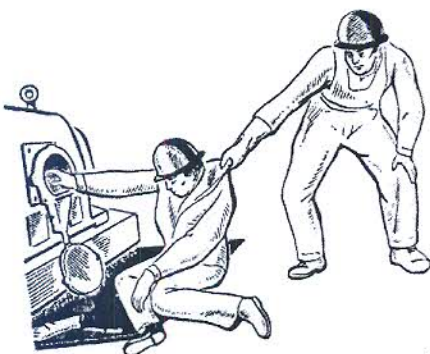
Рис. 3. Освобождение пострадавшего от