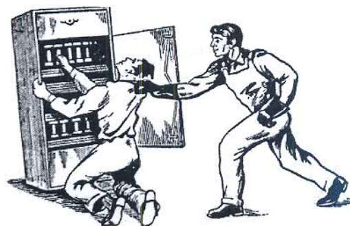
Рис. 4. Освобождение пострадавшего от