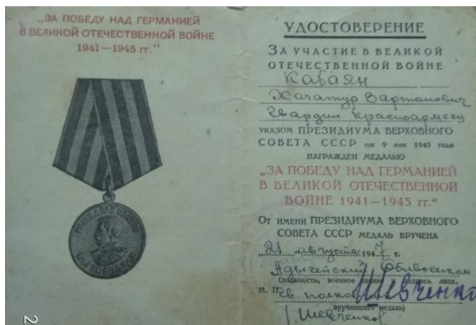
Медаль за Победу над Германией в Великой Отечественной войне

печать: Народно-освободительные войска Штаб XIII корпуса. Югославия.