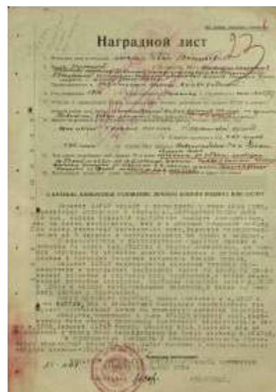
Наградной лист ордена «Слава», 1945 г.