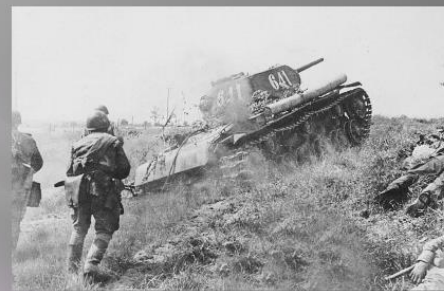
Июль 43-го. Курская дуга.