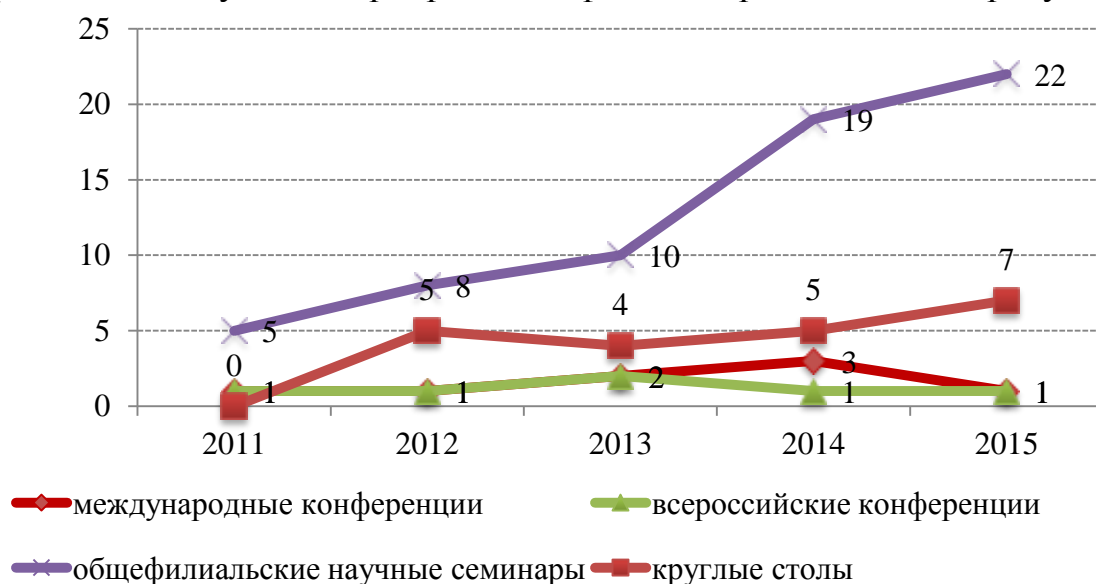
Рисунок 1. Динамика проведения научных мероприятий в Липецком филиале Финуниверситета

Научно-исследовательская работа преподавателей филиала носит систематический и результативный характер. Это во многом определяется наличием организационных мероприятий внутри кафедр, которые дают возможность развивать исследования различной научной направленности, а также взаимодействовать между кафедрами, решая общие проблемы на уровне проведения семинаров, конференций, совместных публикаций. Динамика организации научных мероприятий в филиале представлена на рисунке 1.