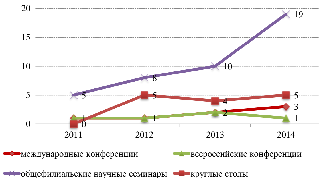
Рисунок 1. Динамика проведения научных мероприятий в Липецком филиале Финуниверситета

Таким образом, в 2014г. в Липецком филиале было проведено: