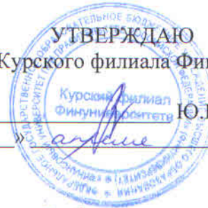
ГРАФИК учебного процесса для студентов 1 - 2 курсов, обучающихся по основным образовательным программам – программам бакалавриата по очной форме обучения на 2019-2020 учебный год