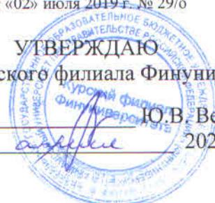
ГРАФИК учебного процесса для студентов 3 - 4 курсов, обучающихся по основным образовательным программам – программам бакалавриата по очной форме обучения на 2019-2020 учебный год