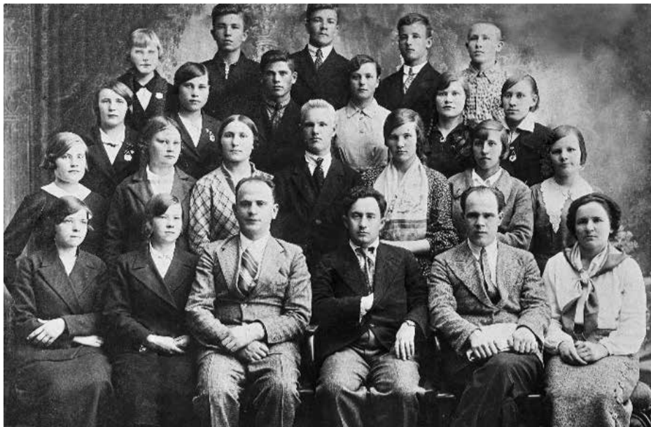
Первые студенты и преподаватели в 1937 году.