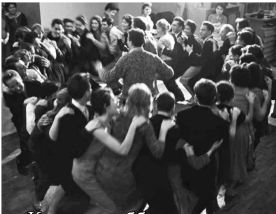
Жили в общежитии в полуподвальном помещении по 18—20 человек в одной комнате. Один раз в неделю, в субботу смотрели кинофильмы и танцевали под звуки аккордеона, баяна и гитары.