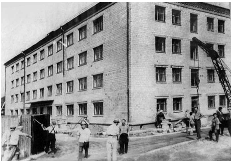
Студенты техникума жили в полуподвальных помещениях: общежитие по ул. Ленина — Сурикова, где в тесноте, в одной комнате ютилось до 28 учащихся. Еще хуже был подвал на 12 человек по ул. Кирова №36, на подпорках, где было сыро и темно. Основная масса учащихся жили на частных квартирах (вернее — углах, без коммунальных услуг). В 1964 году — введено в эксплуатацию общежитие №1 на 240 мест (ул. Декабристов, 45), в 1972 году — общежитие №2 на 360 мест (ул. Маерчака). Тогда техникум единственный в городе обеспечивал благоустроенным общежитием.