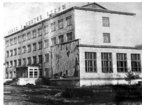
В декабре 1970 г. техникум переехал в новое здание по ул. Маерчака, 20. Здесь было 17 учебных аудиторий и 2 лаборатории. До января месяца занимались в две смены, затем в одну. Техникум получил просторный спортивный и актовый залы. Библиотека и читальный зал были связаны между собой лифтом подачи книг. В 1971—1972 учебном году была оборудована и приступила к работе столовая на 80 посадочных мест.

В 2019 ГОДУ КРАСНОЯРСКИЙ ФИЛИАЛ ВОЗГЛАВИЛ ПАВЕЛ ВЛАДИМИРОВИЧ КЛАЧКОВ. НАЧАЛСЯ НОВЫЙ ЭТАП РАЗВИТИЯ ФИЛИАЛА. НОВЫЕ СТАНДАРТЫ, НОВЫЕ ПРОГРАММЫ, КАПИТАЛЬНЫЙ РЕМОНТ УЧЕБНОГО КОРПУСА!