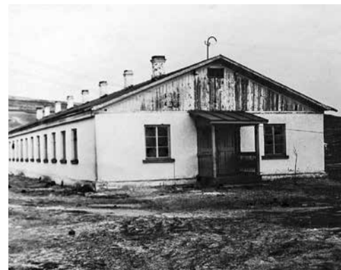
В 1957 г. техникум построил общежитие — барак по ул. Цимлянской, 21, общежитие по улице Кирова было предоставлено мальчикам. В 1961 г. сдан в эксплуатацию шестнадцати квартирный дом для преподавателей и учащихся по ул. Республики, 40.