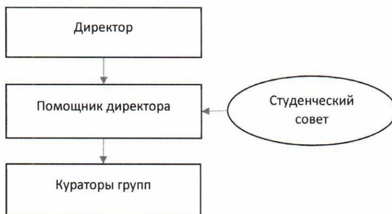
Рис. 1. Структура организации социальной и воспитательной работы в Краснодарском филиале Финуниверситета.

Структура воспитательной работы Краснодарского филиала представлена на рисунке 1.