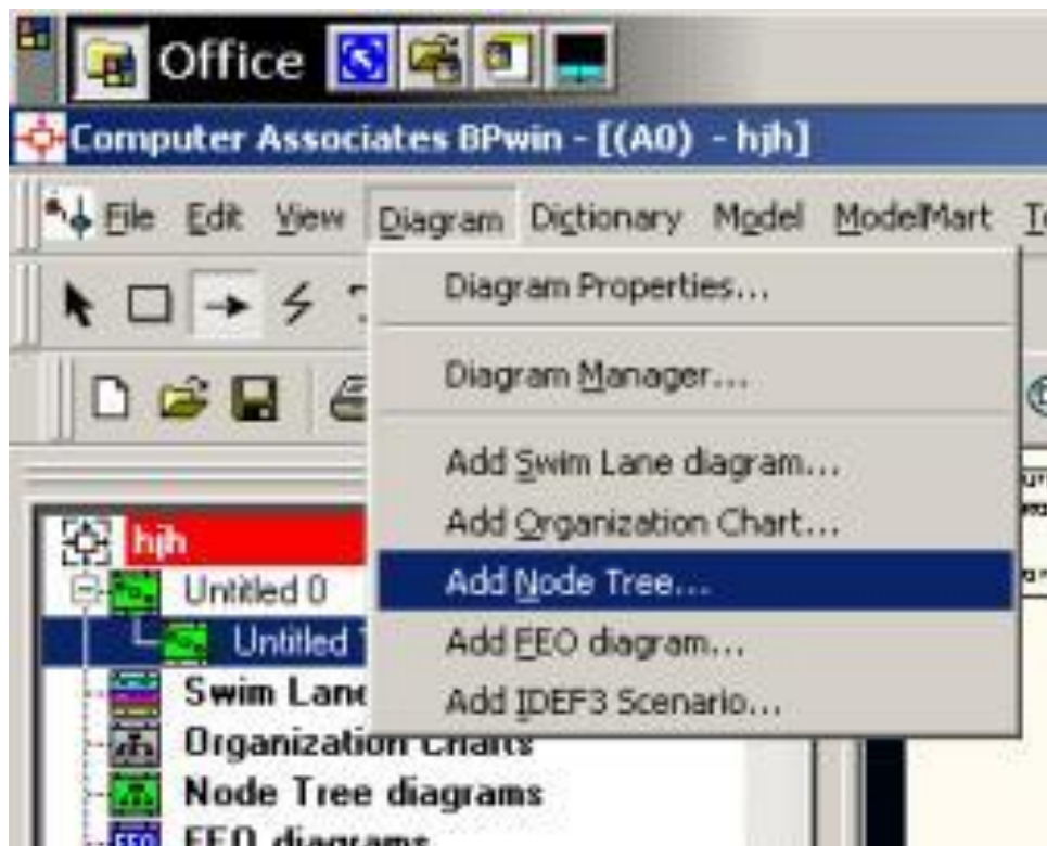
Рис. 2. Выбор команды для формирования диаграммы дерева узлов