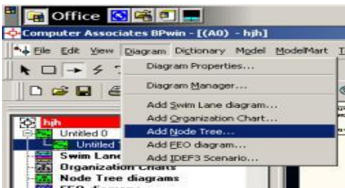
Рис. 2. Выбор команды для формирования диаграммы дерева узлов

Для создания диаграммы дерева узлов следует выбрать в меню пункт Diagram/Add Node Tree (рис. 2). Возникает диалог формирования диаграммы дерева узлов Node Tree Definition (рис. 2).