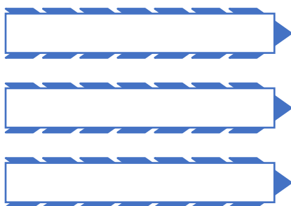
Рисунок 9.1 Название рисунка

9.6. Если в работе имеются схемы, таблицы, графики, диаграммы, рисунки, то их следует располагать непосредственно после текста, в котором они упоминаются впервые, или на следующей странице. Иллюстрации следует нумеровать арабскими цифрами сквозной нумерацией (то есть по всему тексту) — и т.д., либо внутри каждой главы — 1.1, 1.2, и т.д.