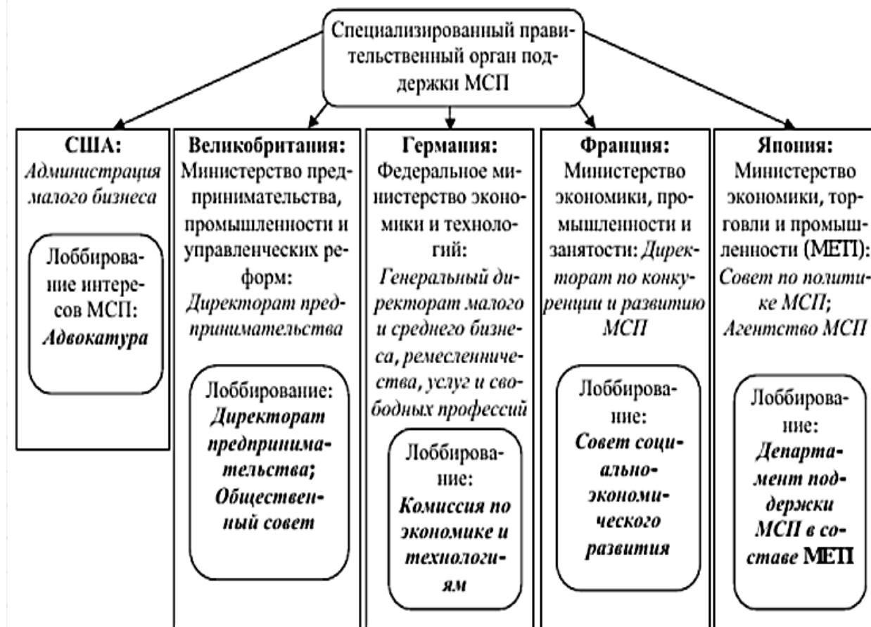
Рисунок 1 – « Специализированные правительственные органы поддержки малого и среднего предпринимательства в развитых странах и структуры, представляющие и защищающие интересы субъектов малого и среднего бизнеса» [1]

ещё в 1953 г. Навык SBA обширно применяется в европейских государствах, Японии и линии иных стран при совершенствовании концепций поддержки малого предпринимательства. Существуют специализированные государственные органы ПМП в разных зарубежных странах (рис.1).