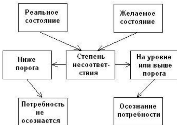
Рисунок 1 – Степень потребности [3]

1. Создание потребности, которое определяется как осознание разницы между желаемым состоянием дел и фактической ситуацией, достаточное, чтобы возбудить и активизировать процесс решения [1].