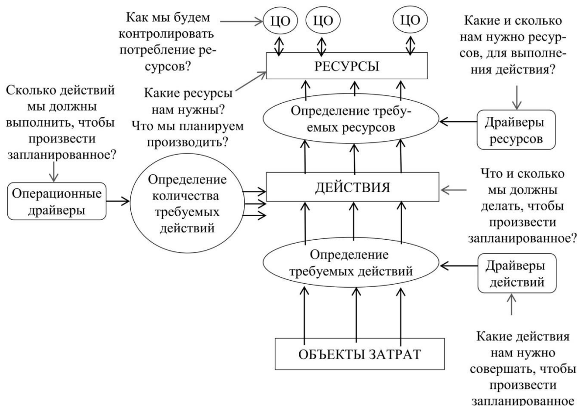
Рисунок 1 – Схема АВВ метода

На рисунке 1 представлена схема АВВ - метода.