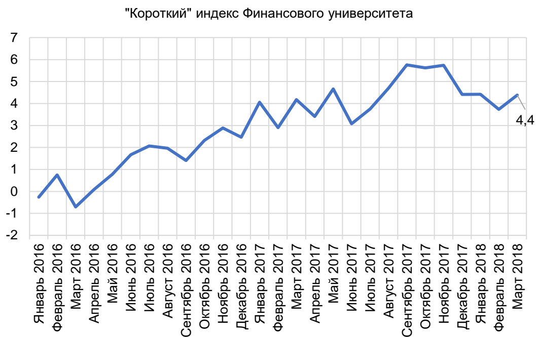
Рисунок 1. «Короткий» индекс Финансового университета при Правительстве РФ в 2016-2018 годах