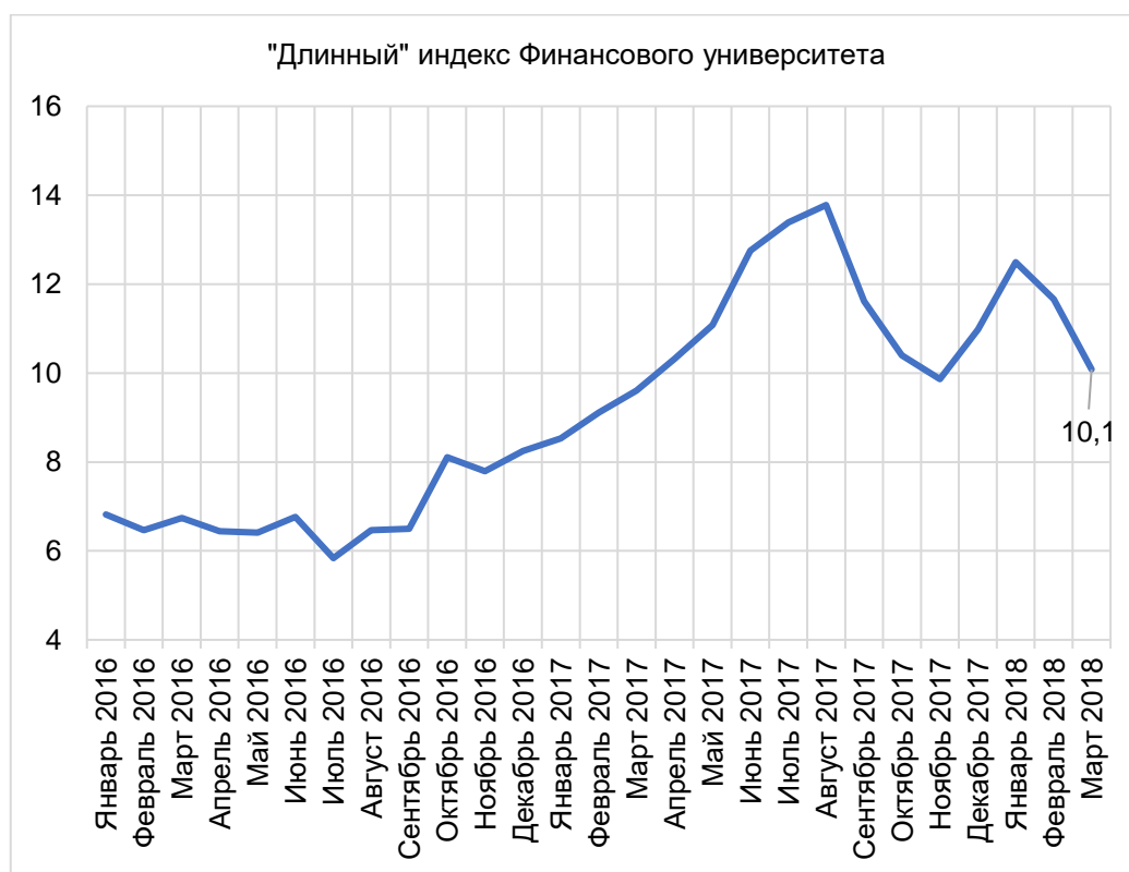
Рисунок 2. «Длинный» индекс Финансового университета при Правительстве РФ в 2016-2018 годах