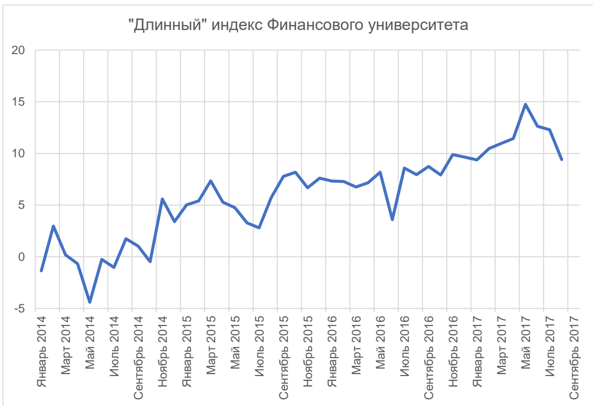
Рисунок 2. «Длинный» индекс Финансового университета при Правительстве РФ в 2014-2017 годах