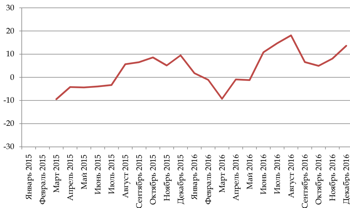
Рисунок 2. Динамика "длинного" Индекса Финансового университета в 2015-2016 гг.