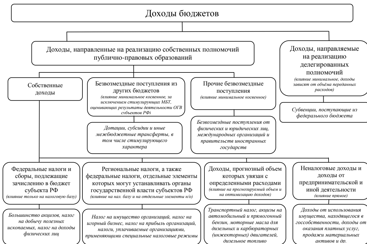
Рисунок 1. Классификация доходов бюджетов субъектов Российской Федерации, основанная на степени влияния региональных органов власти на уровень доходов

оказывают значительное влияние на доходную базу региональных бюджетов. С целью выявления резервов роста доходов бюджетов и наращивания доходного потенциала региона разработана классификация доходов, основанная на их видовой сущности и степени влияния на них региональных органов государственной власти.