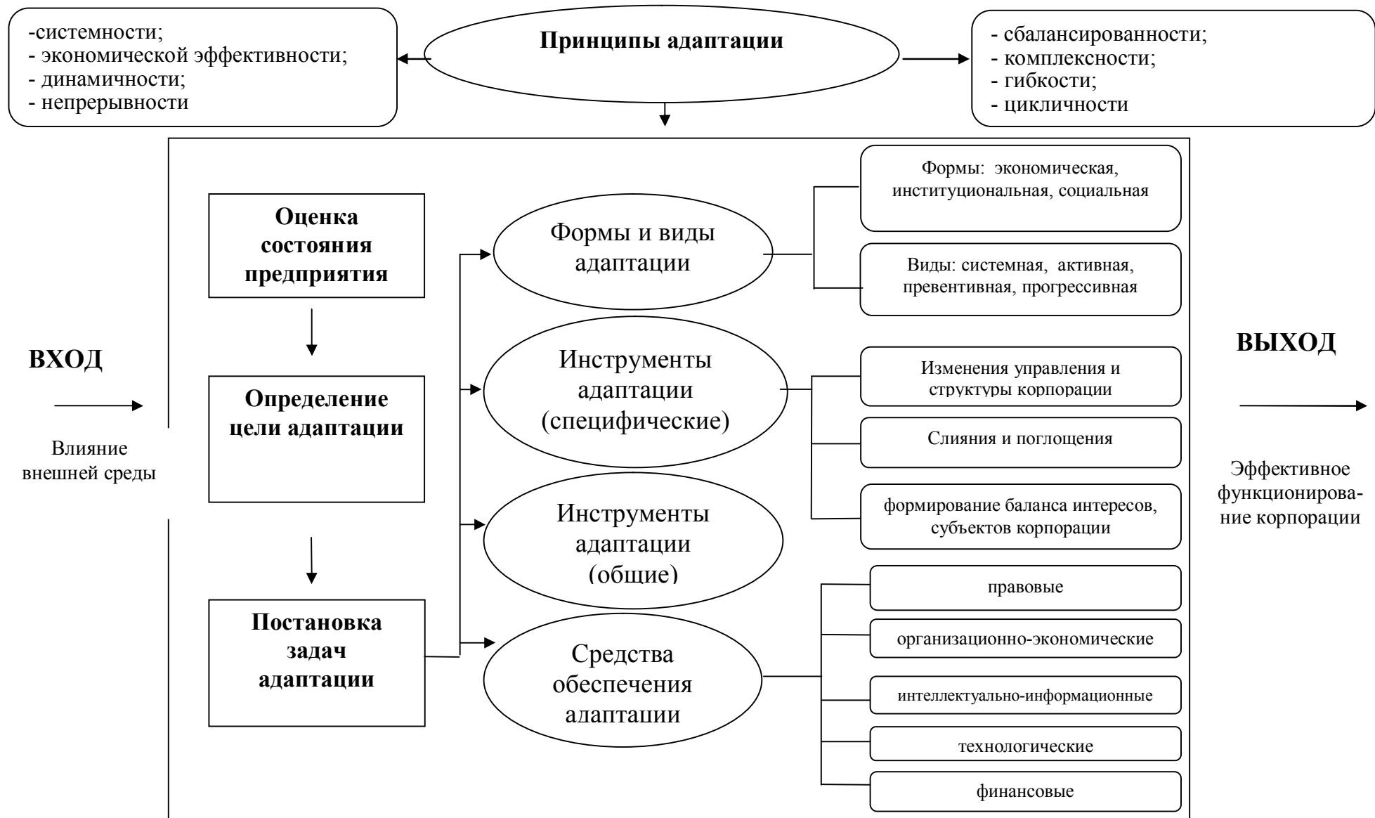
Рис. 2 – Схема организационно-экономического механизма адаптации промышленной корпораций