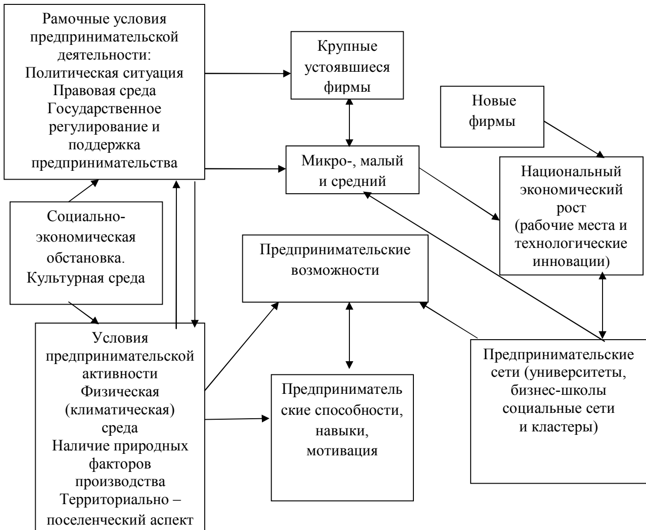
Рисунок 1 - Структурная модель предпринимательской среды Структурная модель предпринимательской среды представлена на рис.1.

производства, ориентация на извлечение прибыли и капитализацию дохода, использование рыночных и других возможностей капитализации дохода, самостоятельность, риски, инициативность и творчество, инновационность, способность преодолевать сопротивление среды, особое управление производством.