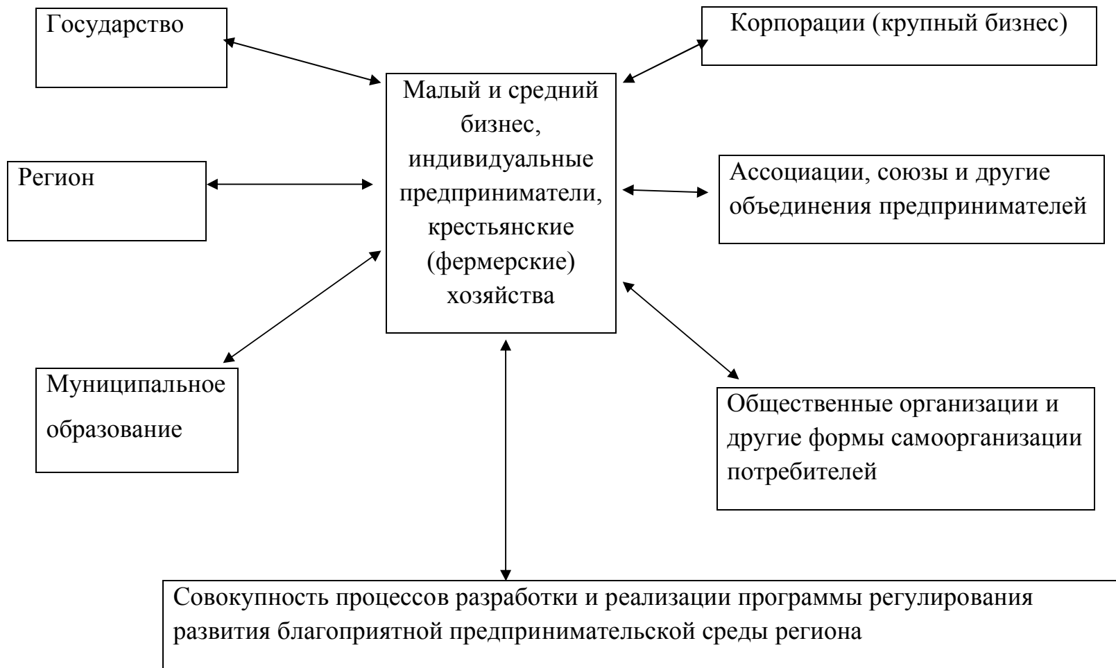
Рисунок 5 - Модель регулирования развития благоприятной предпринимательской среды региона