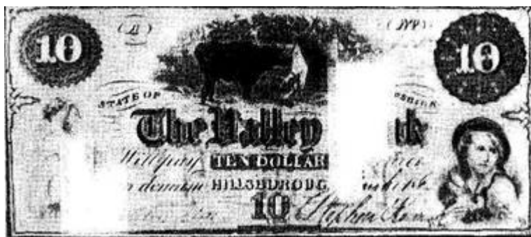
Рис. 6. На снимке банкнота, выпущенная одним из так называемых банков «дикой кошки» - «Валлей банк», возникшего в одном из самых маленьких американских штатов - Нью-Гэмпшир. На самом деле никакого «Валлей бэнк» в этом штате и вообще в Соединенных Штатах не было. Подобных банков в середине XIX века в США было несметное множество

бумагами. Для того чтобы стать «банком», нужно было соблюсти весьма несложные условия и, зарегистрировавшись в установленном порядке, приступить к печатанию билетов. В стране появилось несметное количество фиктивных банков, получивших название «банки дикой кошки». Они так засорили денежные протоки государства, что исчезла реальная возможность определить, что это за денежный знак - настоящий, «от дикой кошки» или просто-напросто фальшивка.