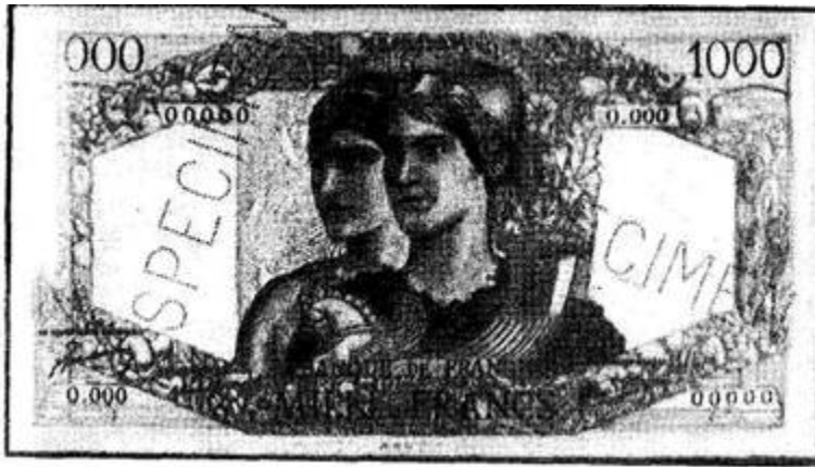
Рис. 11. Банкнота в 1000 старых франков, изготовленная Чеславом Боярски в начале его деятельности, которая чуть не потрясла всю финансовую систему Франции