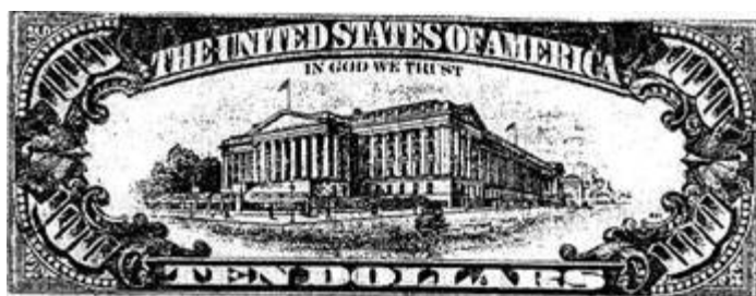
Рис. 14. На снимке своеобразный шедевр отечественных фальшивомонетчиков.

Банкнота достоинством в 10 долларов, мастерски переделанная в 100-долларовую купюру путем наклейки бумажки с изображением цифры «100»