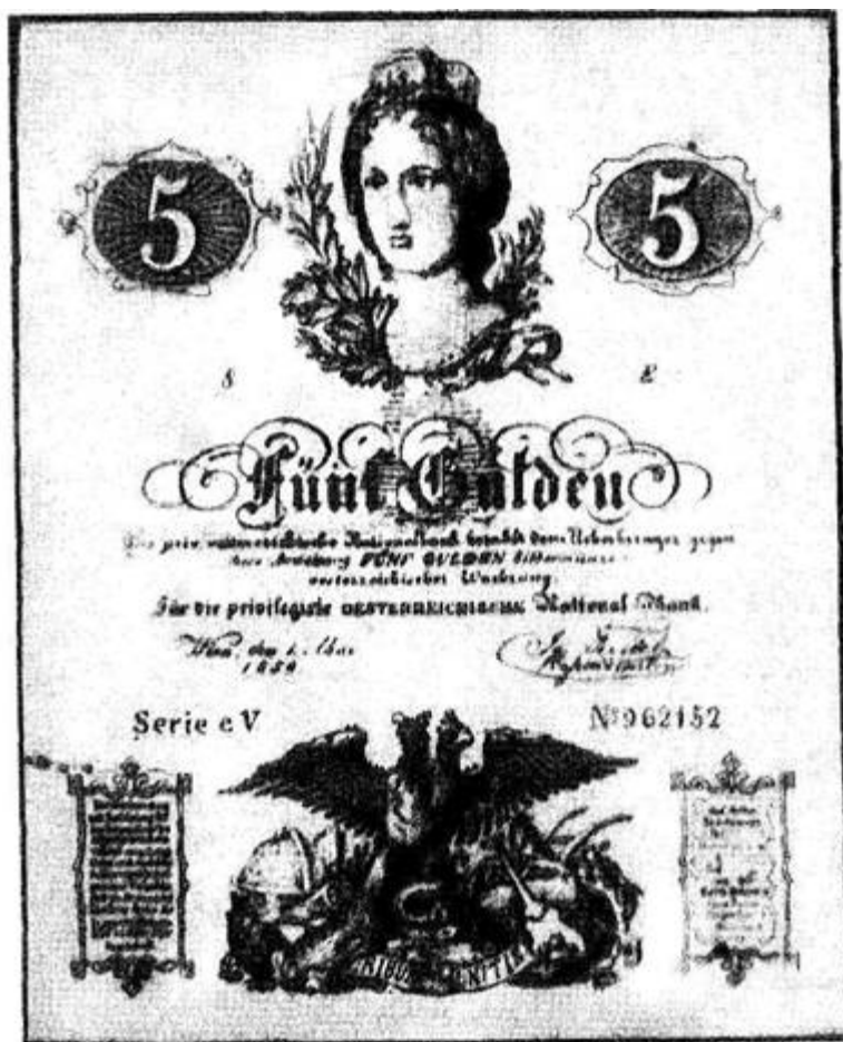
Рис. 7. На этом уникальном снимке - один из первых экземпляров «творческой деятельности» знаменитого Эмануэля Нинджера. Свои первые шаги в качестве фальшивомонетчика он начал на родине, в Германии, откуда потом вынужден был срочно иммигрировать в Новый Свет, чтобы избежать уголовного наказания. На снимке австрийская банкнота в 5 гульденов, вышедшая из-под пера гениального преступника

Ни для кого не секрет, что в арсенале государств и их правительств, кроме явных, имеются еще и скрытые средства оказания давления на другие государства. В их числе подрыв экономики того или иного государства путем массового печатания и распространения фальшивых денежных знаков.