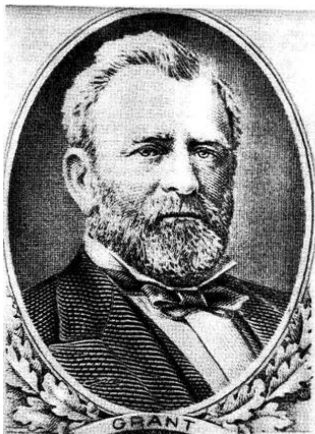
Рис. 15. Изображение бюста президента Гранта на банкноте достоинством в 50 долларов - подлинная.

И последний совет: приобретая доллары США, обращайте внимание на год выпуска банкноты, так как в банки принимают долларовые купюры, начиная только с 1963 года, а в пункты обмена - начиная с 1980 года.