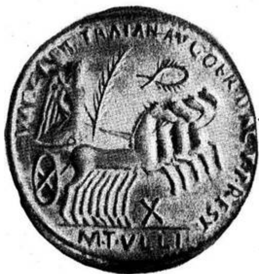
Рис. 13. Типичная современная подделка римского динария времен императора Траяна. Бросается в глаза несоответствие написания легенды принятым в то время типичным шрифтовым стандартам