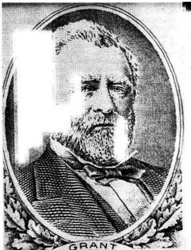
Рис. 16. Изображение бюста президента Гранта на банкноте достоинством в 50 долларов - поддельная, где заметна нечеткость в изображении волос на голове, бороде и усах: белые пятна, более темная тень в глазницах и под носом

Располагая не очень сильной лупой, советуем вам, например, обратить внимание на синтетическую нить, которая протянута через всю банкноту в 100 долларов. Там нанесена мелко-мелко: «100 USA 100 USA 100 USA...» Эта надпись на поддельных банкнотах неразличима и является собой сплошную линию, даже если смотреть в сильный микроскоп.