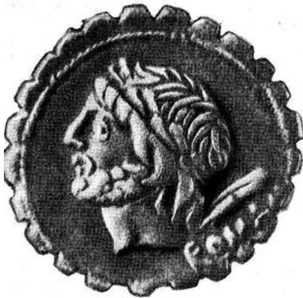
Рис. 3. Римская монета, изготовленная в 106 году нашей эры. Зубцы, идущие по гурту, - слабая попытка предотвратить подделку

Существовали два метода «государственного фальшивомонетничества». Либо правительство ставило на монетах меньшего веса и объема обозначение старой, более тяжелой монеты. Либо оно уменьшало вес благородного металла, базы монетной ценности примесью дешевого металла. И в царской России не раз использовали эти методы, чтобы спасти страну от финансового краха. Профессор М.И.Боголепов в своем известном труде «Государственный долг» (Спб., 1910 год) писал: «В 1801 году, на заседании Государственного Совета читалась записка «Об уменьшении в России золотых и серебряных монет» в которой говорилось: «Крайнее истощение, в которое государство приведено было в начале минувшего столетия шведской войной, заставило Великого Монарха прибегнуть к непозволительному средству для наполнения своих недостатков. Испорчена была медная монета в количестве, в каком она никогда не была прежде». Профессор приводит далее слова германского финансиста Эренберга: «Фактически ухудшение монеты большинством государств совершалось безостановочно, как в средние века, так и в XVI и XVII столетиях».