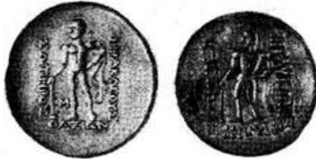
Рис. 1. Слева греческая монета тетрадрахма, справа ее двойник, так называемая «варварская» подделка. Так назывались чаще всего фальшивые монеты, изготовленные варварами, т.е. людьми негреческой национальности.

Во время недавних раскопок в Англии одного из древних поселений викингов археологи нашли старинную арабскую монету. Сам по себе этот факт уникален. Он вновь подтвердил, что в те далекие времена связи народов были неизмеримо более обширные, чем нам это порою кажется.