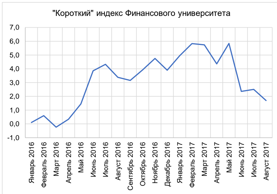
Рисунок 2. «Короткий» индекс Финансового университета при Правительстве РФ в 2016-2017 годах