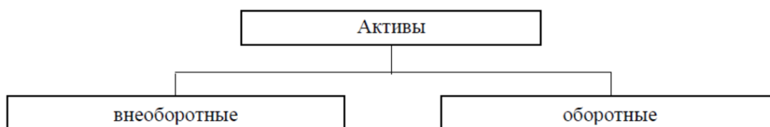
Рисунок 1 – Классификация активов

Название графиков, схем, диаграмм помещается под ними, по центру, пишется без кавычек и содержит слово «Рисунок» и указание на порядковый номер рисунка, без знака №., после цифры ставят тире. Точку в конце наименования рисунка не ставят.