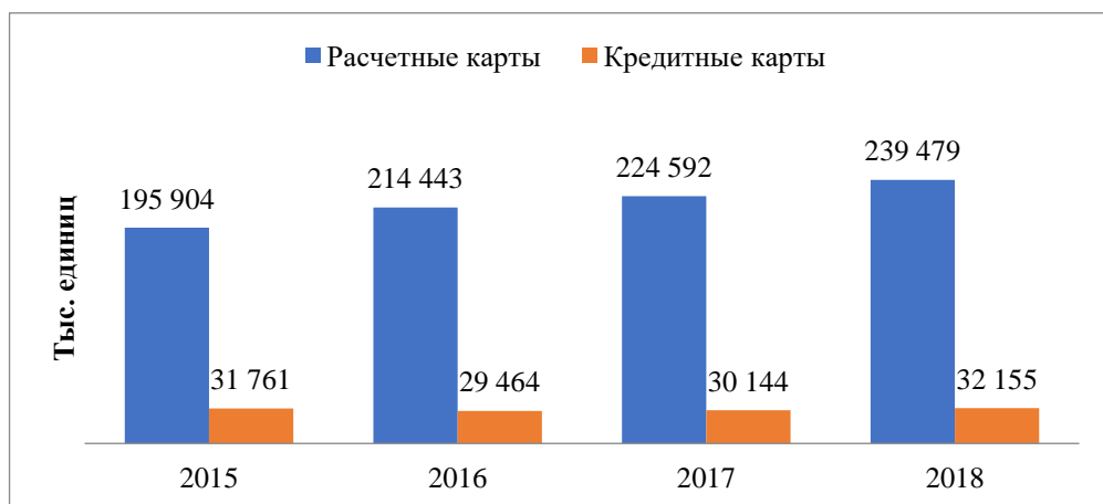
Рисунок 1 - Динамика расчетных и кредитных карт, эмитированных российскими кредитными организациями, тыс. единиц