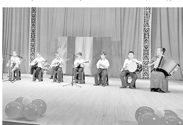
Содержательная концертная программа была представлена учащимися школы в преддверии Дня защиты детей.

Овациями зрителей были вознаграждены все выступления как успешных уже завоевавших призы на детских международных, всероссийских и республиканских конкурсах и фестивалях, так и тех, кто впервые раз выступил перед столь солидной аудиторией.