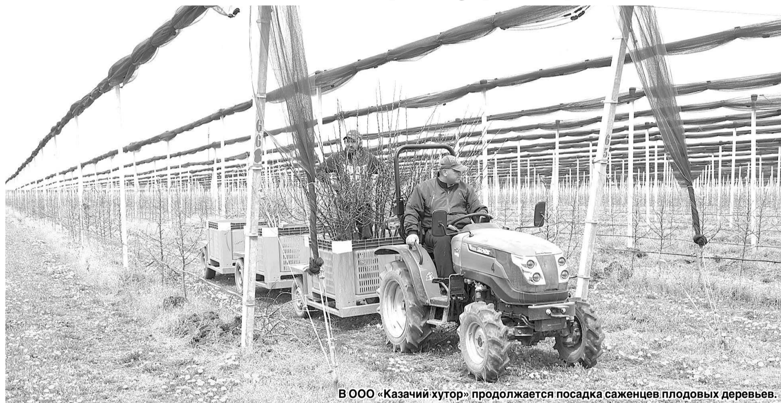
В ООО «Казачий хутор» продолжается посадка саженцев плодовых деревьев.

Реализация планов социально-экономического развития муниципальных образований, а также отдельных целевых программ требует привлечения инвестиций. Муниципальная власть заинтересована в создании условий для привлечения и удержания инвестиций на своей территории.