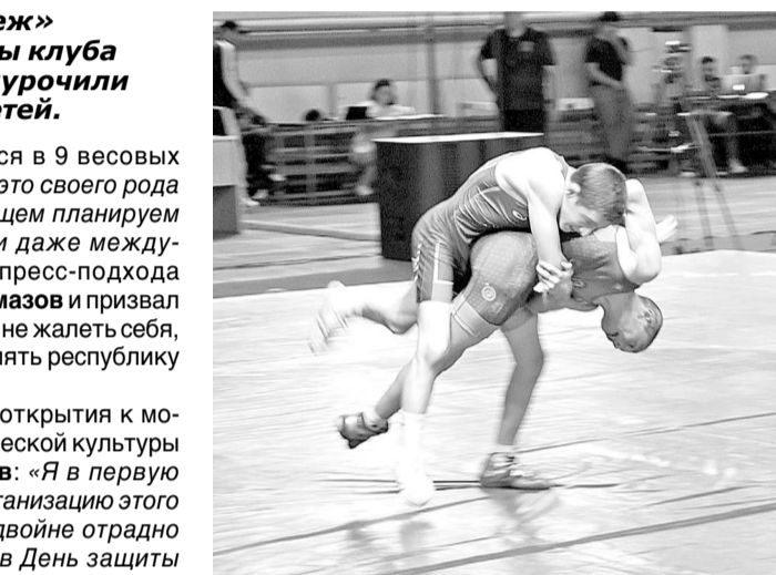
ответственность. В перерывах между поединками удаётся пообщаться с некоторыми спортсменами.

Во дворце спорта «Манеж» стартовал турнир на призы клуба «Берсеркеры». Приурочили событие к Дню защиты детей.