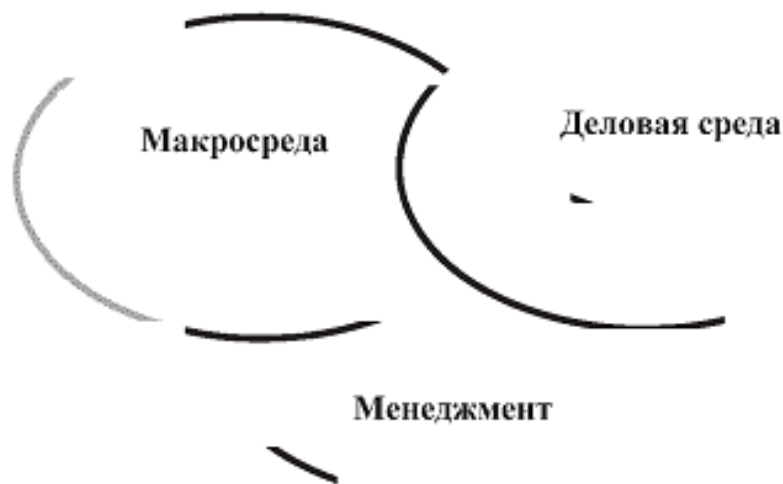
Рисунок 1. Рыночная среда финансовой устойчивости фирмы

Ситуационная модель состояния ФУ к моменту времени t представляется в виде трех компонент: