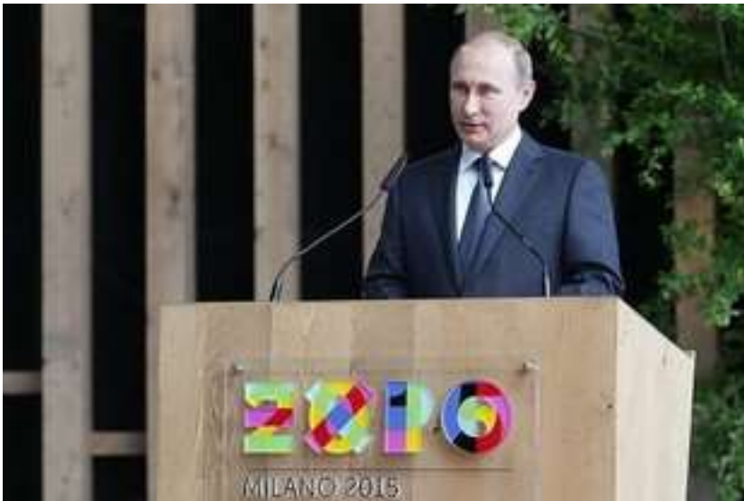
Владимир Владимирович Путин – Президент Российской Федерации

Однако официальное название "День России" закрепилось за праздником лишь в 2002 году, когда в силу вступил новый Трудовой кодекс Российской Федерации, в котором были прописаны новые праздничные дни и выходные. День России традиционно отмечается массовыми народными гуляниями, спортивными мероприятиями и концертами.