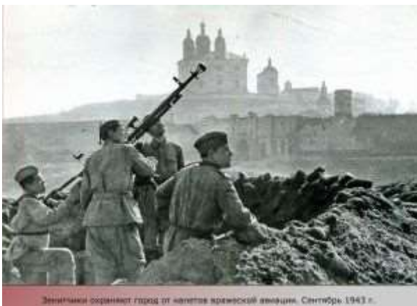
Зенитчики охраняют горах от авиаторов кремлевской авиации. Сентябрь 1943 г.

Летом-осенью 1941 года на Смоленской земле серьезно и фатально забуксовал знаменитый немецкий блицкриг. Сюда пришелся самый мощный удар группы армий «Центр» - основного шипа вражеского трезубца. Но план молниеносной войны с захватом Москвы до наступления холодов впервые наткнулся на упорное и организованное сопротивление, до того только отступавшей Красной Армии, опиравшейся на посильную помощь нашего народа. Фашисты были вынуждены периодически переходить к обороне и потеряли на Смоленщине два месяца. За это драгоценное время советскому командованию удалось подтянуть резервы из глубины страны и подготовить Вяземскую и Можайскую линии обороны столицы.