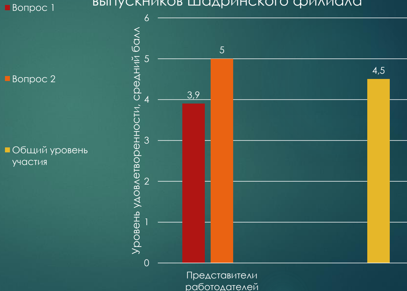
Участие работодателей в трудоустройстве выпускников Шадринского филиала