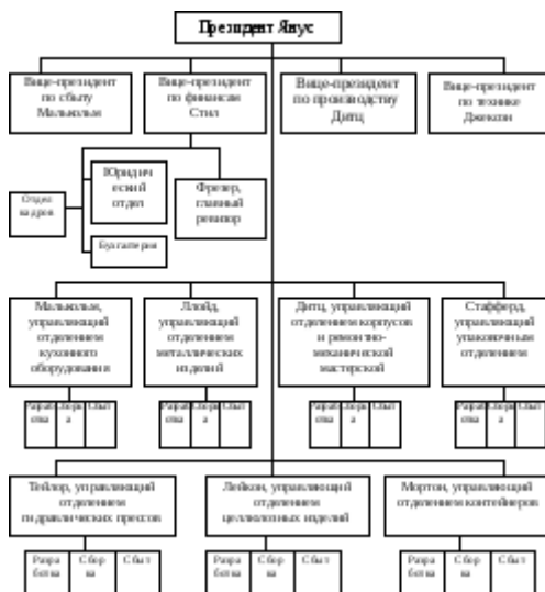
Рис. 3.1. Организационная структура фирмы «Сигма»

Кроме того, было проведено объединение всех работников, связанных со снабжением, в централизованный отдел снабжения в подчинении вице-президента по производству. Созданы централизованная бухгалтерия и отдел обслуживания. Централизация однородных функций осуществлялась в целях экономии на постоянных расходах в результате увеличения масштабов производства.