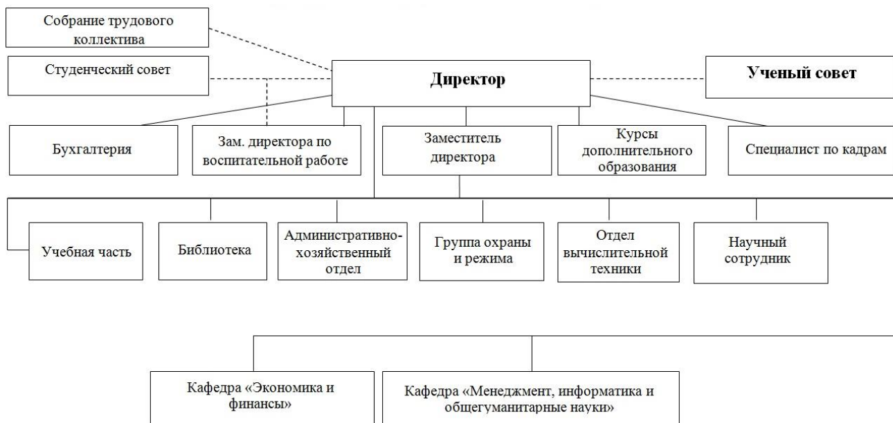
Рисунок 1. Структура Пензенского филиала Финуниверситета.

коллегиальности, участия преподавателей, сотрудников, студентов в работе Ученого совета филиала.