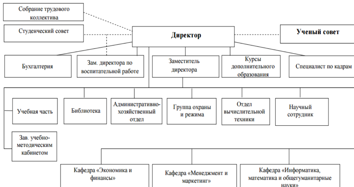
Рисунок 1. Структура Пензенского филиала Финуниверситета.