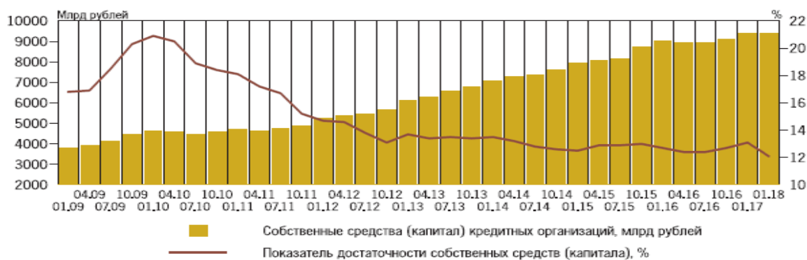
Динамика достаточности капитала

Задача (30 баллов). На основе представленных данных проведите анализ динамики собственных средств (капитала) и достаточности капитала кредитных организаций. Выделите причины изменения приведенных показателей в исследуемом периоде. Оцените влияние изменений приведенных показателей на устойчивость банковской сферы России. Какие меры в рамках изменения данных показателей предпринимает регулятор для повышения устойчивости банковской системы РФ?