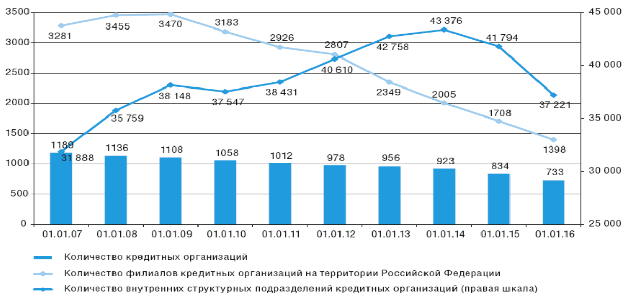
Рисунок 1. Количество кредитных организаций и их филиалов, ед.

3. На рисунке представлена динамика количества кредитных организаций и их филиалов. Дайте характеристику уровня институционального развития банковской сферы России. К какому типу банковских систем по развитию филиальной сети относится банковская сфера России? Ответ подтвердите расчетом необходимого показателя.