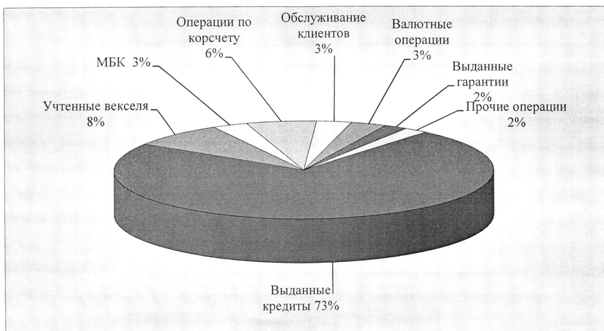
Рисунок 1 - Структура доходов ООО «XXX» в 2009 г.