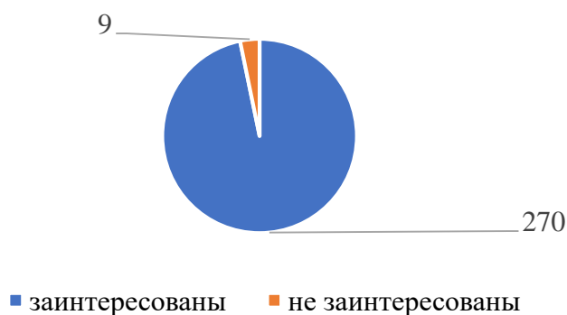
Рисунок 4 - Заинтересованность работодателей в привлечении студентов на практику

Сферы деятельности работодателей, принявших участие в опросе в 2023 году весьма разнообразны.