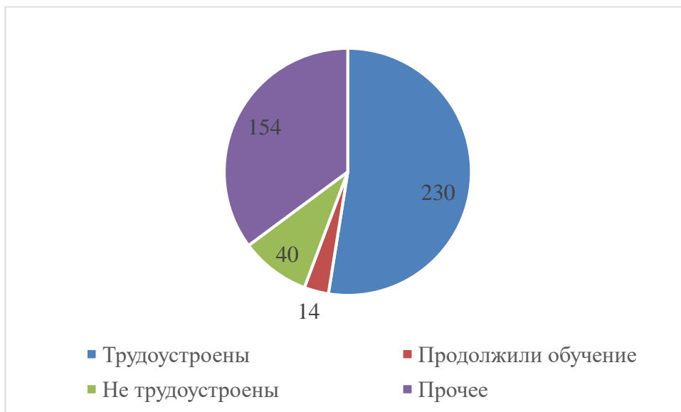
Рисунок 2 - Анализ востребованности и трудоустройства выпускников

Из общего количества выпускников 2023 года (438 чел.) трудоустроились в течение 6 месяцев с момента получения диплома 52,6% (230 чел.), продолжили обучение 3,4% (14 чел.), не трудоустроены 9,3% (40 чел.) (рисунок 2).