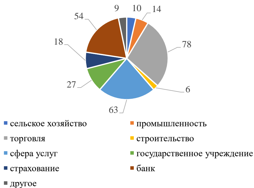
Рисунок 3 - Сфера деятельности работодателей

Сферы деятельности работодателей, принявших участие в опросе в 2023 году весьма разнообразны.