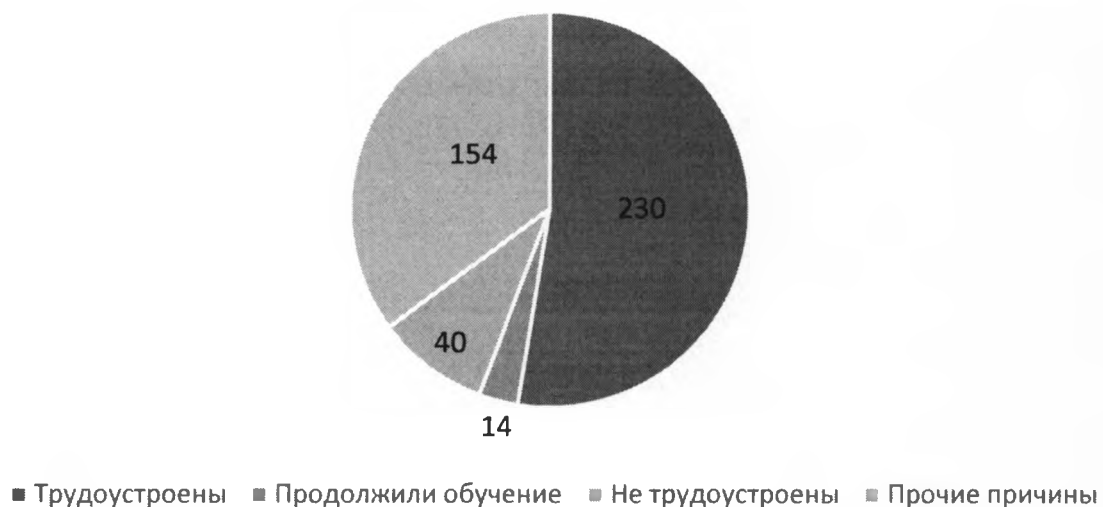
Рисунок 1 - Анализ востребованности и трудоустройства выпускников

Из общего количества выпускников 2023 года (438 чел.) трудоустроились в течение 6 месяцев с момента получения диплома 52,6% (230 чел.), продолжили обучение 3,4% (14 чел.), прочие причины 35,2% (154 чел.) не трудоустроены 9,3% (40 чел.) (рисунок 1).