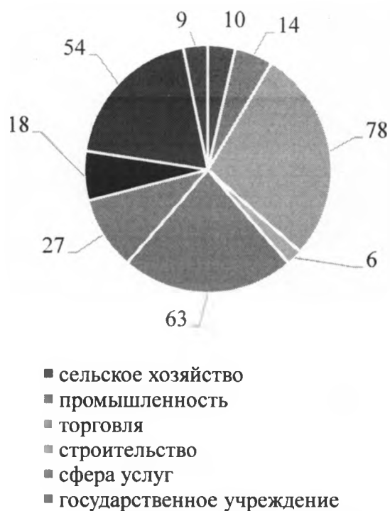
Рисунок 2 - Сфера деятельности работодателей

Сферы деятельности работодателей, принявших участие в опросе в 2023 году весьма разнообразны.