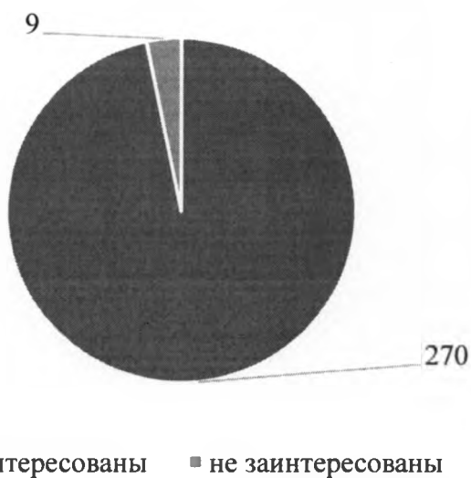
Рисунок 3 - Заинтересованность работодателей в привлечении студентов на практику

Сферы деятельности работодателей, принявших участие в опросе в 2023 году весьма разнообразны.