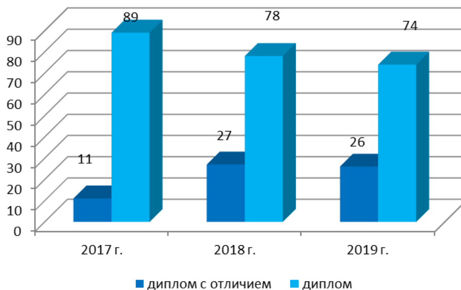
Рисунок 3. Доля дипломов с отличием в 2017 - 2019 гг.

Содержание учебного процесса и научно-исследовательской работы студентов Филиала ориентировано на подготовку специалистов, конкурентоспособных и востребованных на рынке труда, обладающих компетенциями, необходимыми для решения профессиональных задач. Для этого используются устойчивые связи кафедр Филиала с крупнейшими предприятиями