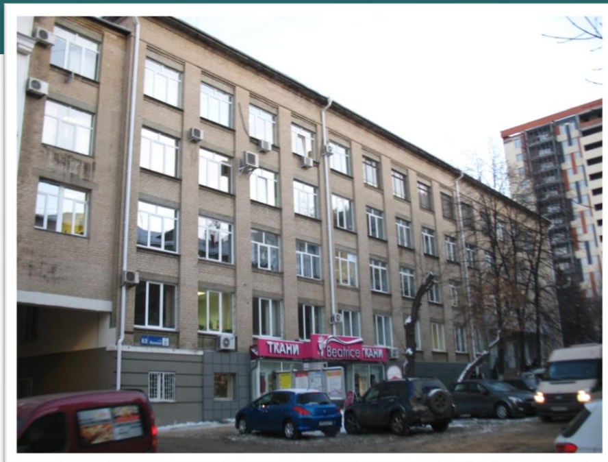
Здание Челябинской областной организации Всероссийского Общества «Знание» в г. Челябинске

С 1965 г. по 1979 г. – преподаватель Челябинского юридического техникума и Челябинского политехнического института.