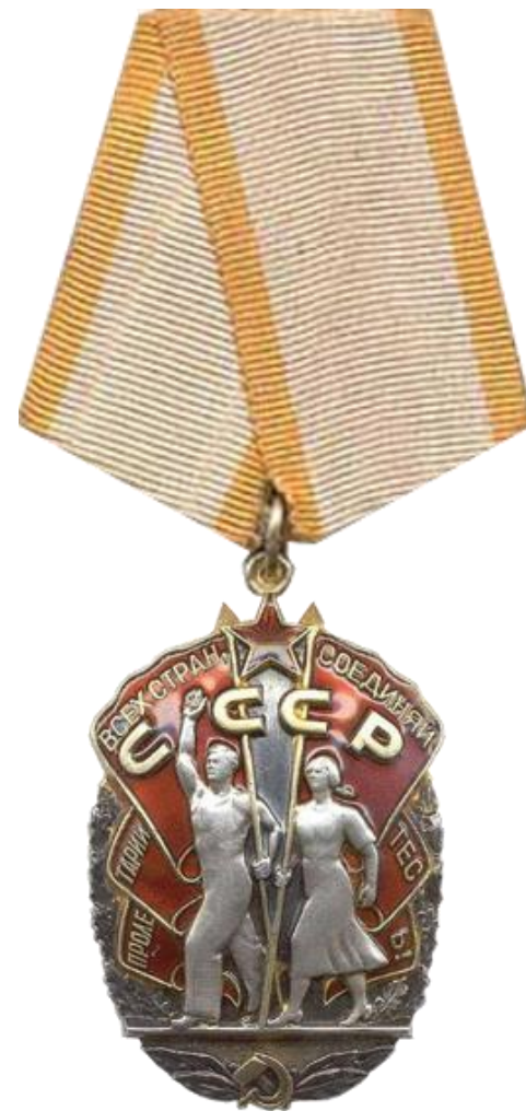
Орден «Знак Почета»