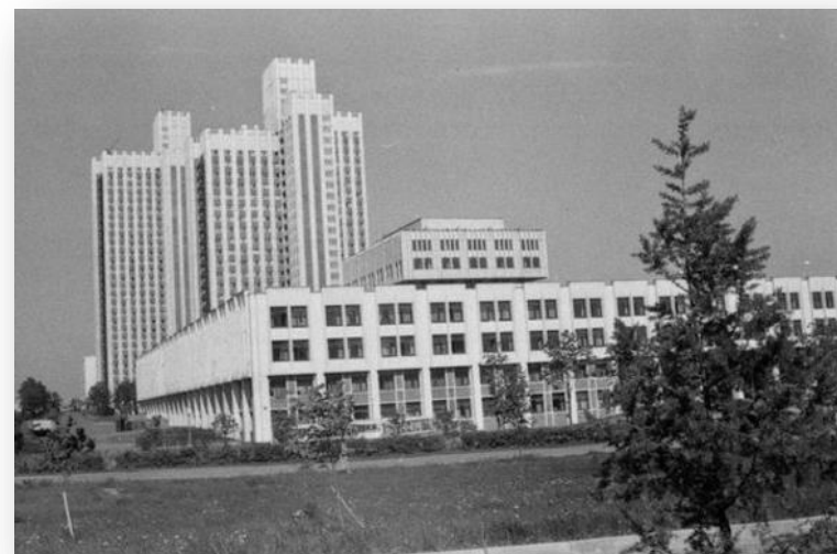
Академия общественных наук при ЦК КПСС в г. Москве (ныне – Российская академия народного хозяйства и государственной службы при Президенте России)

В 1952 г. окончил Уральский политехнический институт . В 1967 г. получил второе высшее образование в Академии общественных наук при ЦК КПСС .