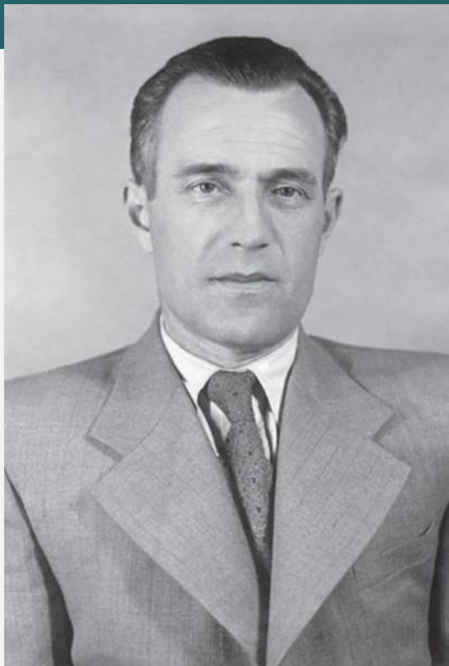
Елютин Вячеслав Петрович (1907 – 1993)

Министр высшего и среднего специального образования СССР (1954 – 1985)