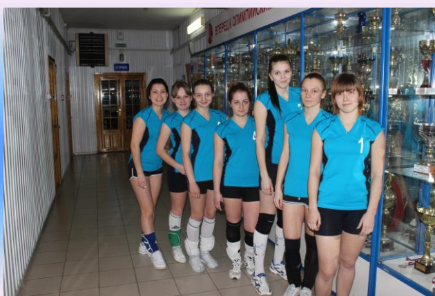
Состав женской волейбольной команды:

Команда девушек финансово - экономического колледжа заняла 1 место, 2 место- БГТИ ,3 место – педагогический колледж. Команда юношей финансово-экономического колледжа заняла 2 место,1 место - колледж промышленности и транспорта ,3 место- лесной техникум