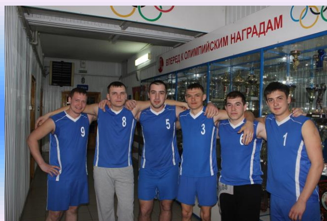
Состав мужской волейбольной команды: