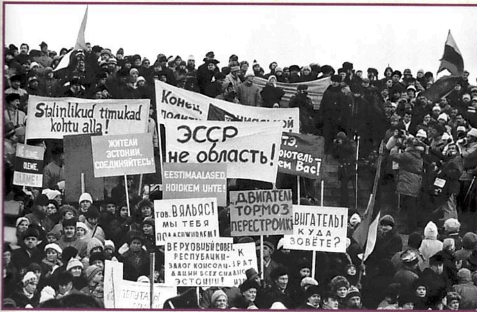
▲ Митинг в Таллине после провозглашения Верховным Советом Эстонской ССР суверенитета Эстонской ССР. 26 ноября 1988 года

Конституции СССР, а свернул в сторону идеи разработки Союзного договора.