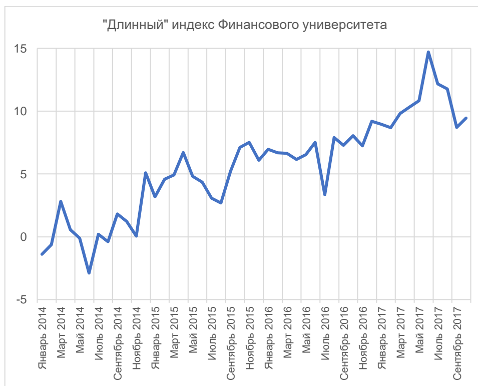
Рисунок 2. «Длинный» индекс Финансового университета при Правительстве РФ в 2014-2017 годах