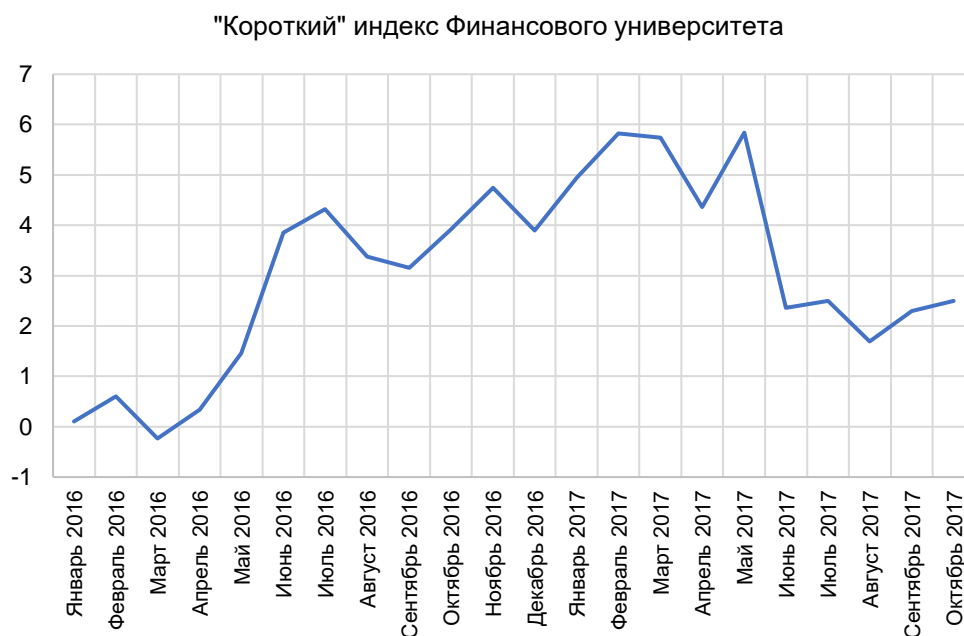
Рисунок 1. «Короткий» индекс Финансового университета при Правительстве РФ в 2016-2017 годах